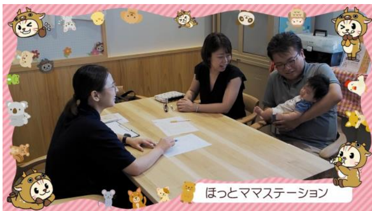
ほっとママステーション