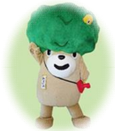
みどりの村キャラクター みどりの