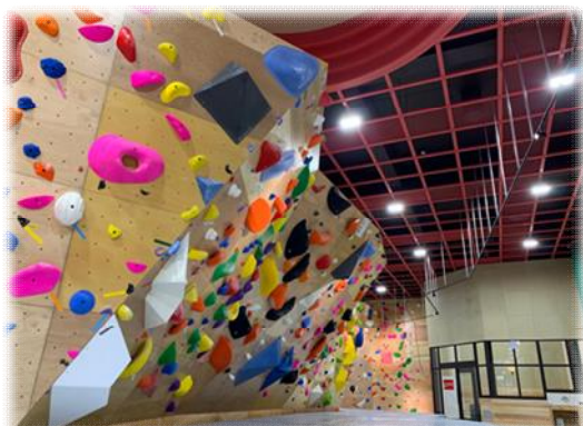
クライミングウォール