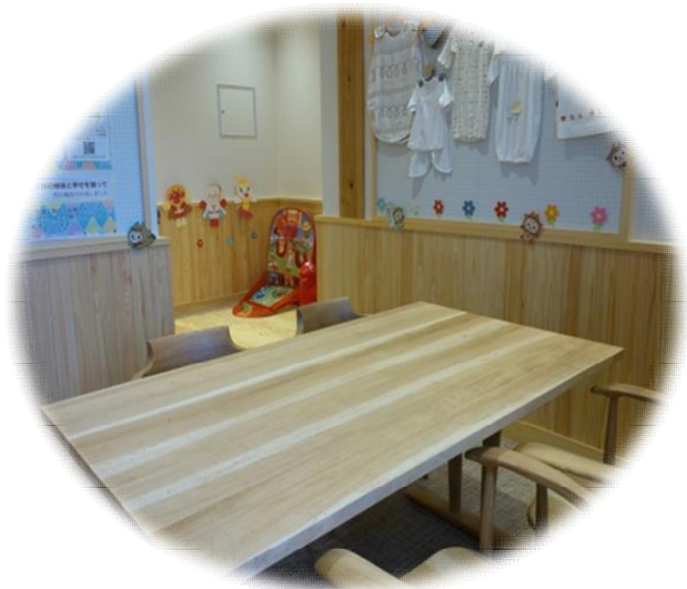
ほっとママステーション

保健師や助産師等が相談に応じ、関係機関と連携しながら、みなさまの子育てを応援します。 お気軽にご相談ください。