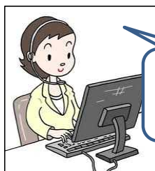
オペレーターが対応