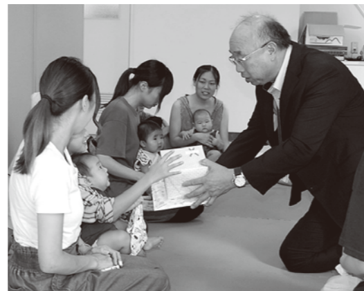
誕生祝い品【すげの幸】