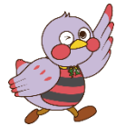
埼玉県マスコット「さいたまっち」