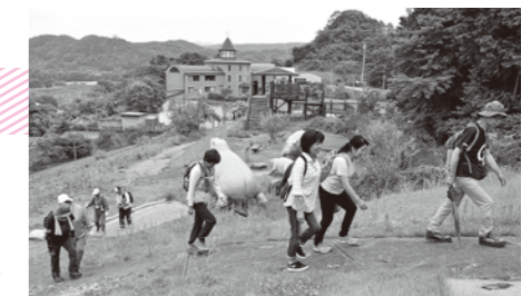
町民ウォーキング

☎75-0063 FAX75-0032 メール syakyo@town.ogano.lg.jp