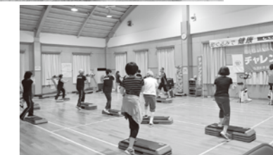
いきいき体操「ステップ体操」