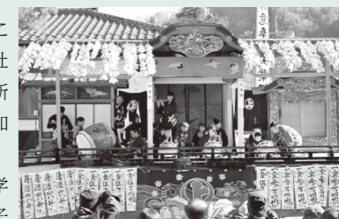
▲地元子ども太鼓会「砲馬会」

三田川小学校6年生の子供歌舞伎以外にも、笠鉦のお囃子を行う「栗尾太鼓会」や昨年結成された地元子ども太鼓会である「砲馬会」による秩父屋台囃子、上飯田子ども歌舞伎「青砥稿花紅彩画白浪五人男稲瀬川勢揃之場」「寿曾我对面工藤館之場」など多くの子どもがお祭りに参加します。地域の伝統文化であるお祭りを未来へ継承していく子どもたちの活躍